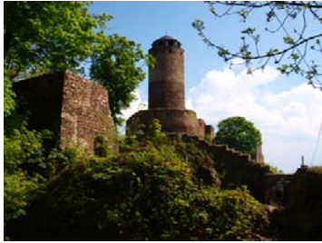
Castle Hassenstein_Hrad Hasištejn_Burg Hassenstein