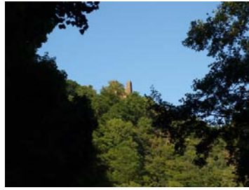
Castle Hassenstein_Hrad Hasištejn_Burg Hassenstein