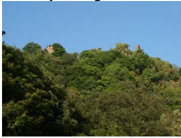
Castle Hassenstein_Hrad Hasištejn_Burg Hassenstein